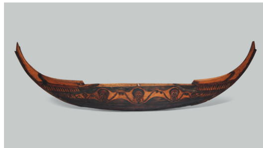
Pirogue Buka, archipel des Iles Salomon. L 194 cm P 33 cm

Société de Ventes Volontaires Agrément n2002-128