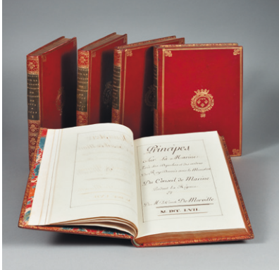
Pidansart de Mairibert, Principes sur la marine , exemplaire de dédicace en maroquin aux armes du duc d'Orléans

Contact Presse_Nathalie du Breuil +33 (0)1 49 49 90 08 - ndubreuil@pba-auctions.com