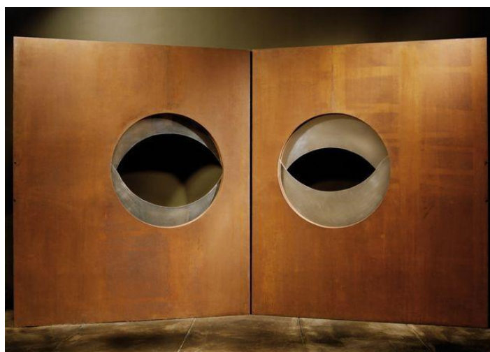
Portes « les yeux » de Yonel Lebovici Estimation : 80 000 / 120 000 €

Salle des Beaux-Arts Grand Sablon 40 Grote Zavel Bruxelles B-1000 Brussel T. +32 (0)2 504 80 30 F. +32 (0)2 513 21 65