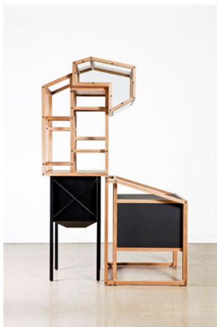
Bureau « architectural » de Mieke Meijer. Estimation : 3 500 / 5 000 €