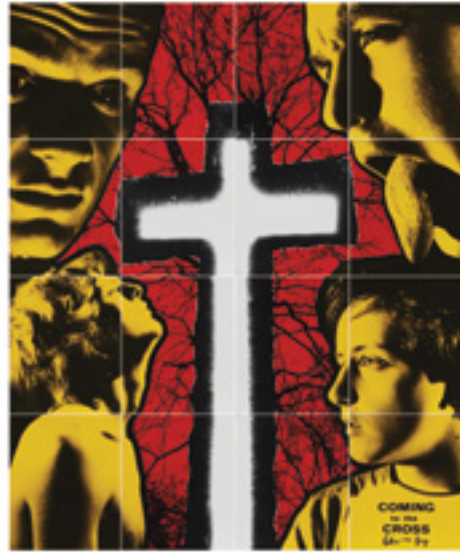
GILBERT & GEORGE Coming to the cross , 1982

Pièce unique. Installation de seize photographies en couleurs. Signée, datée et titrée en bas à droite.