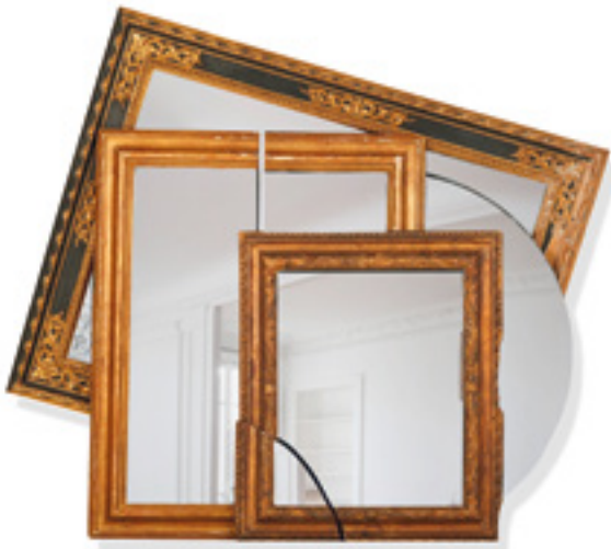
MICHELANGELO PISTOLETTO (NÉ EN 1933)