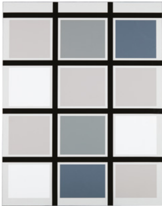
GERWALD ROCKENSCHAUB (NÉ EN 1952) Sans titre , 2000. Feuilles de couleur sur Alucore. Signé au dos. H_190 cm L_149 cm 8 000 / 10 000 €

DATE DE LA VENTE Jeudi 14 juin 2018 - 15 heures et 19 heures