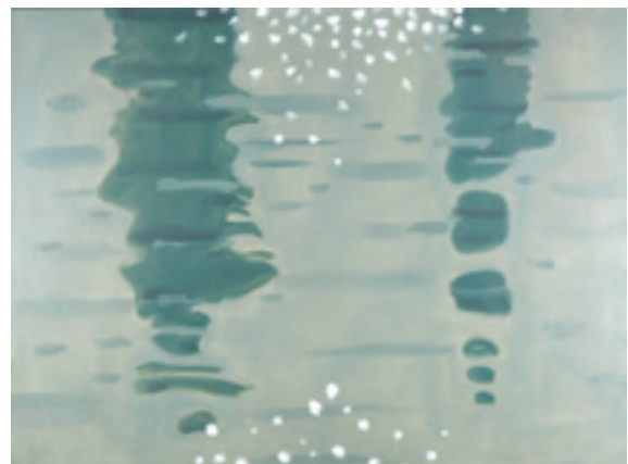
ALEX KATZ (NÉ EN 1927)

Green reflections #2 , série Black Brook, 1999