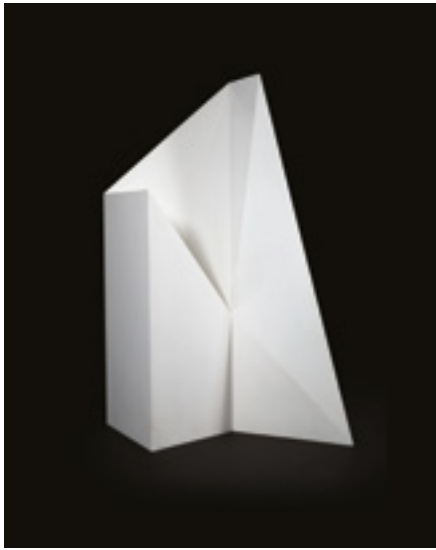
SOL LEWITT (1928-2007) Complex Form #64 , 1989

Pièce unique. Sculpture en bois peint. H_152 cm L_93 cm P_91 cm