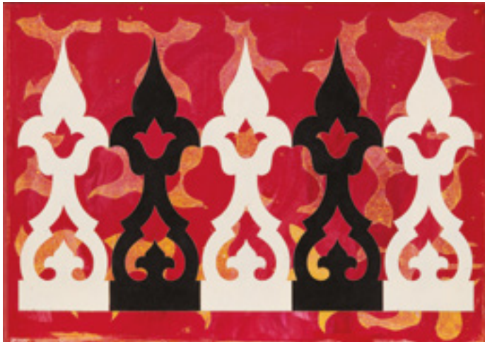
PHILIP TAAFFE (NÉ EN 1955)