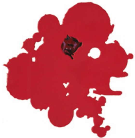
TONY OURSLER (NÉ EN 1957)