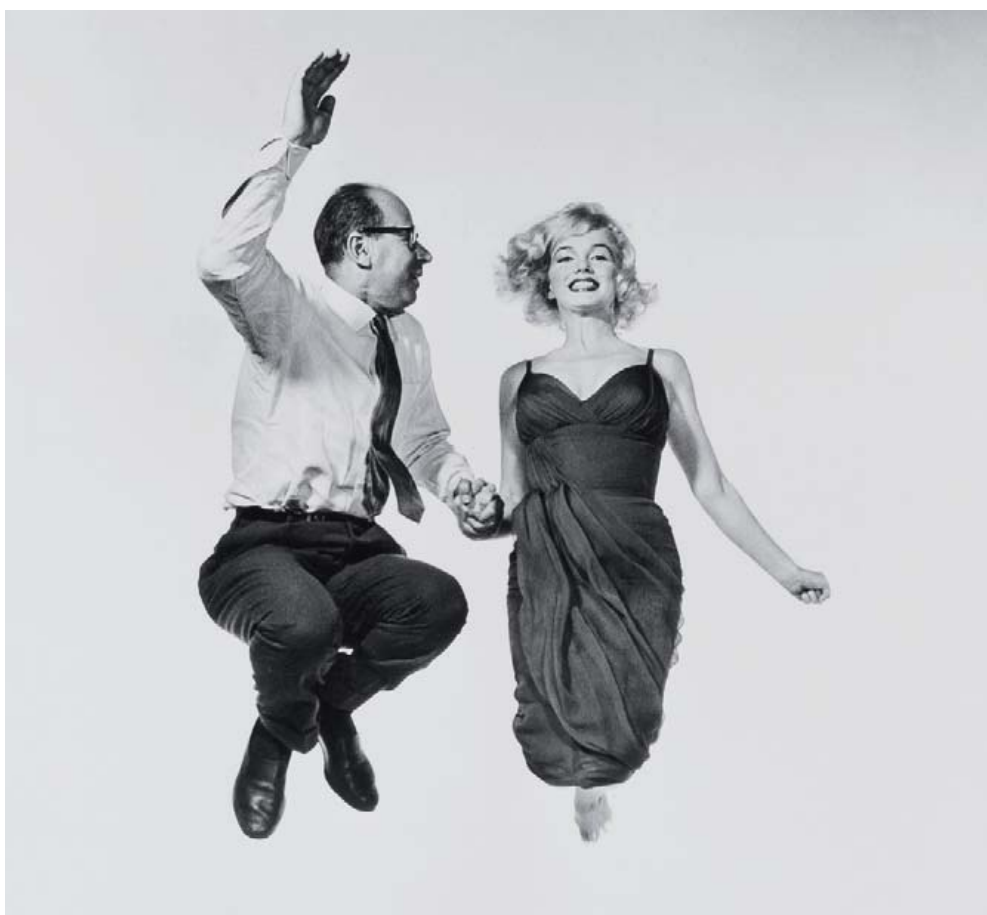
Philippe Halsman (1906-1979) Philippe Halsman and Marilyn Monroe, Jump series, around 1959 Tirage argentique d'époque. Cachet au dos. H_32 cm L_26 cm. 6 000 / 9 000 €