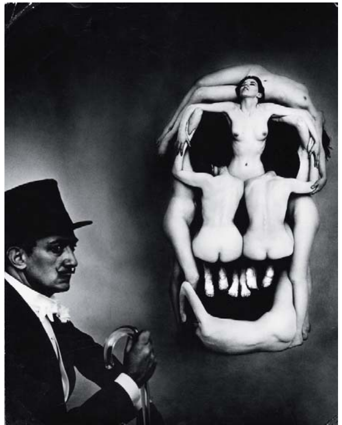
Philippe Halsman (1906-1979) Salvador Dali, In Voluptate Mors , 1951 Tirage argentique d'époque. Cachet au dos. H_32 cm L_26 cm 6 000 / 8 000 €

VENTE Vendredi 1 er avril 2016 à Drouot Richelieu - Salle 4