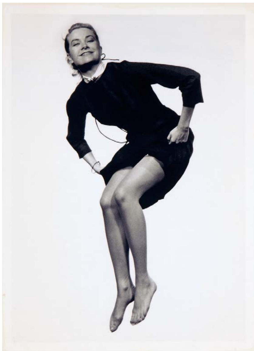
Philippe Halsman (1906-1979) Jump series, Grace Kelly, vers 1954 Tirage argentique d'époque. Tampon au dos. H_18 cm L_13 cm